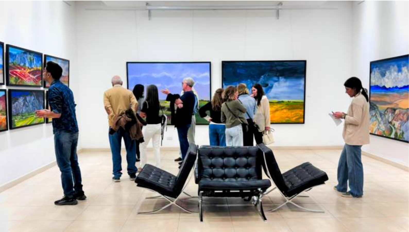
Museo Carlos Alonso