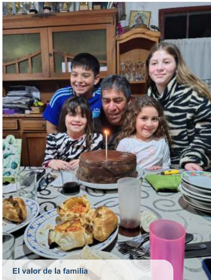
El valor de la familia

“Le dedico esta medalla a mi familia, a mis amigos y a toda la gente de Villegas, que es a quien fui a representar”, dijo orgulloso. Contó que lo que más lo emocionó fue que lo eligieran para representar a Villegas en el escenario principal de los Juegos Bonaerenses. “Creo que fue por mi trayectoria dentro del deporte, y eso para mí fue muy emocionante”.