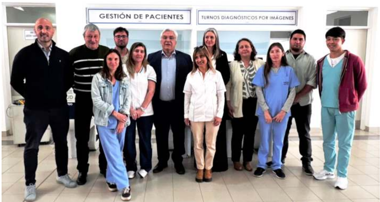
Autoridades junto a integrantes de los CAPS de las localidades y encargados.

técnico, emocional y psicológico al personal de enfermería, que muchas veces trabaja solo y debe tomar decisiones en la urgencia”, explicó.