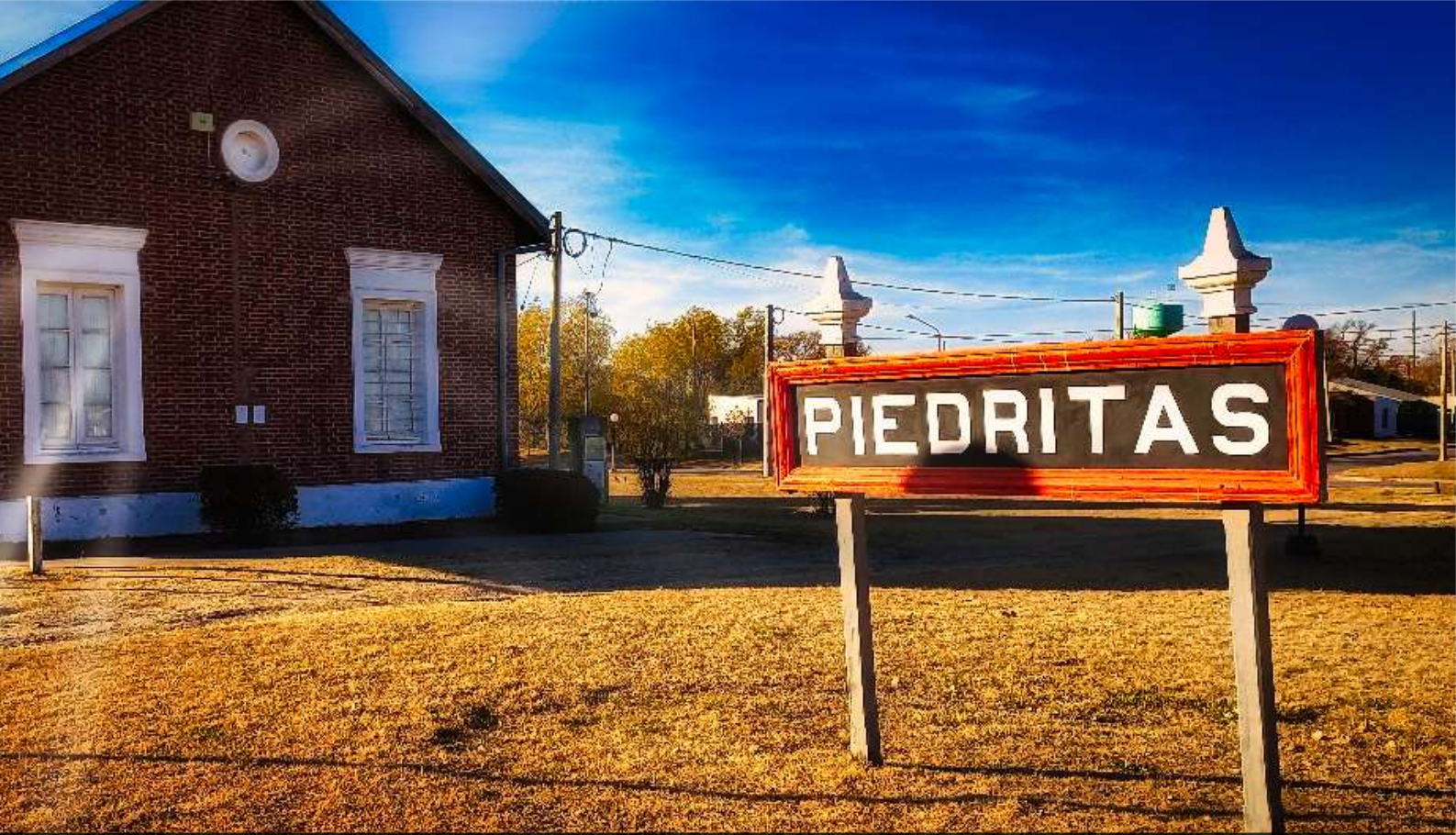
Estación de ferrocarril. Piedritas.